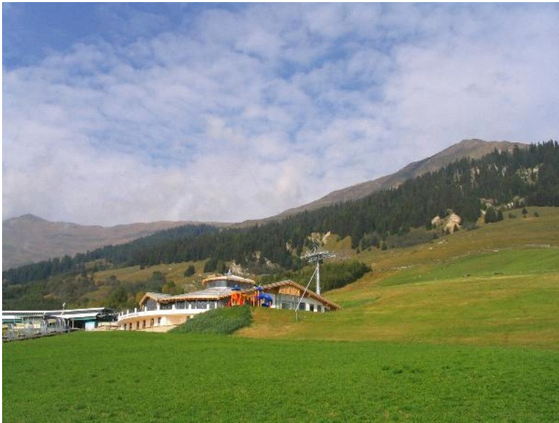
Blick vom LP-Fiss zum Gipfelgrat mit Startplatz (2436m):